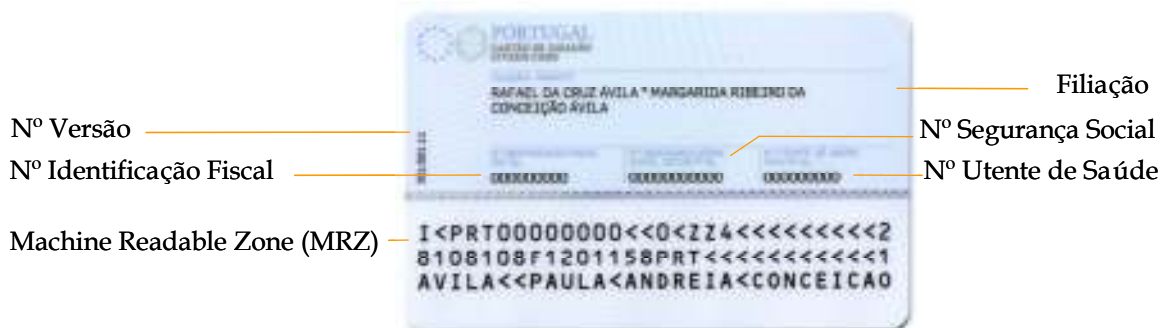
Figura 1-2 Informação inscrita no verso do cartão

O verso do cartão de cidadão contém informação textual específica dos actuais documentos de identificação sectoriais (Finanças, Segurança Social e Saúde) do titular, bem como uma zona de leitura óptica – Machine Readable Zone (MRZ).