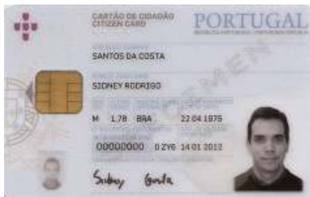
Figura 4-1 Frente do cartão de cidadão