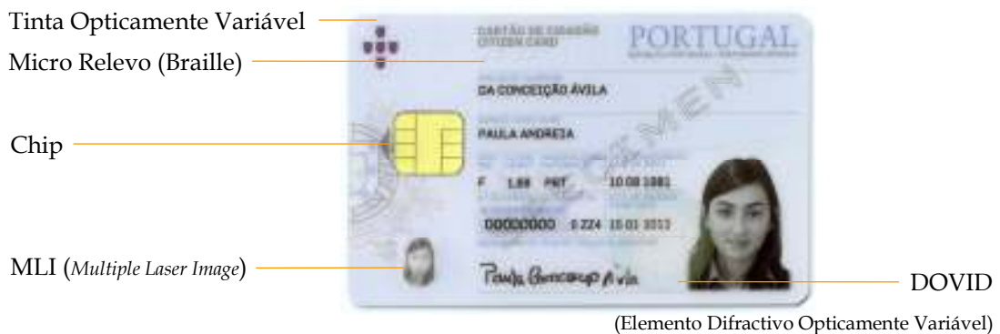
Figura 6-1 Características de segurança simples na frente do cartão de cidadão