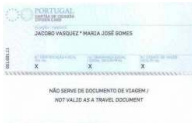
Figura 5-2 Verso do cartão de cidadão

Nesta situação o cartão de cidadão apresenta a validade de apenas de 1 ano, tendo em conta o disposto no artigo 61.º da Lei n.º 7/2007, de 5 de Fevereiro.