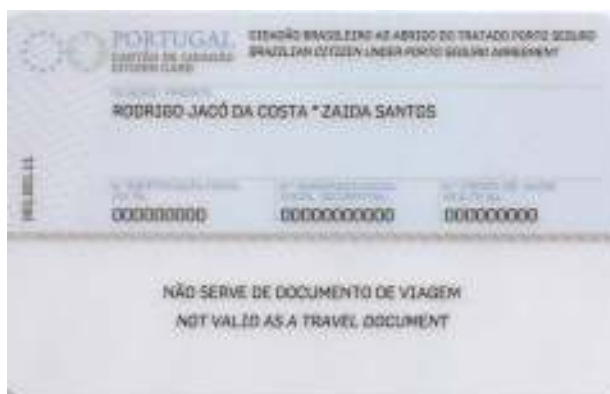
Figura 4-2 Verso do cartão de cidadão

Na zona de leitura óptica consta a menção de que o cartão de cidadão não serve como documento de viagem. Esta especificação decorre do disposto na Lei n.º 7/2007, de 5 de Fevereiro e no Decreto-Lei n.º 154/2003, de 15 de Julho.