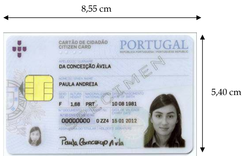
Figura 3-1 Frente do cartão de cidadão