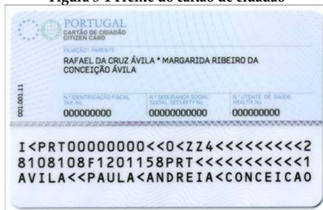
Figura 3-2 Verso do cartão de cidadão