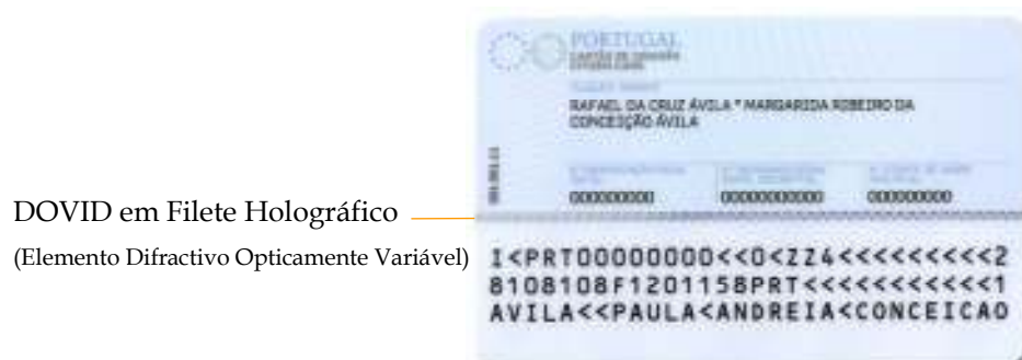
Figura 6-2 Características de segurança simples no verso do cartão de cidadão