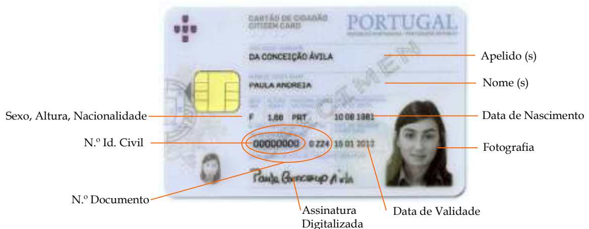
Figura 1-1 Informação inscrita na frente do cartão

A frente do cartão de cidadão contém informação textual específica sobre a identificação do seu titular.