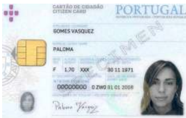
Figura 5-1 Frente do cartão de cidadão