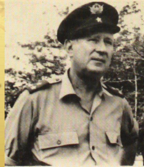
Kaúlza de Oliveira Arriaga (1915-2004)