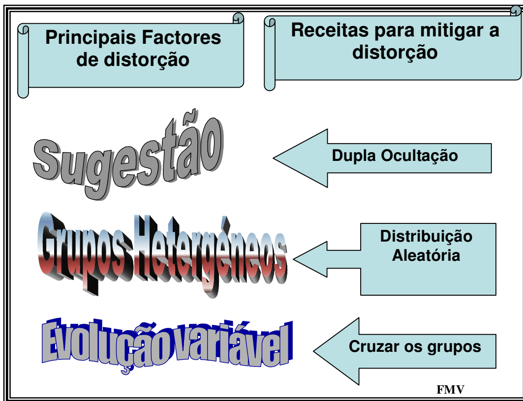
Fig.-1. Principais factores de erro que podem enviesar os resultados num ensaio clínico, e receitas da Farmacologia Clínica para os evitar.

possamos mitigá-los por uma metodologia rigorosa (Fig. -1) que a Farmacologia Clínica concebeu no último quartel do Século XX: 1-administrar as terapêuticas em moldes de ocultação para evitar o efeito da sugestão no doente, ou de dupla ocultação para também evitar a do investigador, 2-administrar as terapêuticas a testar em grupos homogêneos obtidos pela distribuição aleatória dos doentes (não se pode concluir pela eficácia dum tratamento se os grupos comparados tiverem diferenças na patologia, idade ou outros factores), e 3-comparando resultados com controles de placebo quando possível.