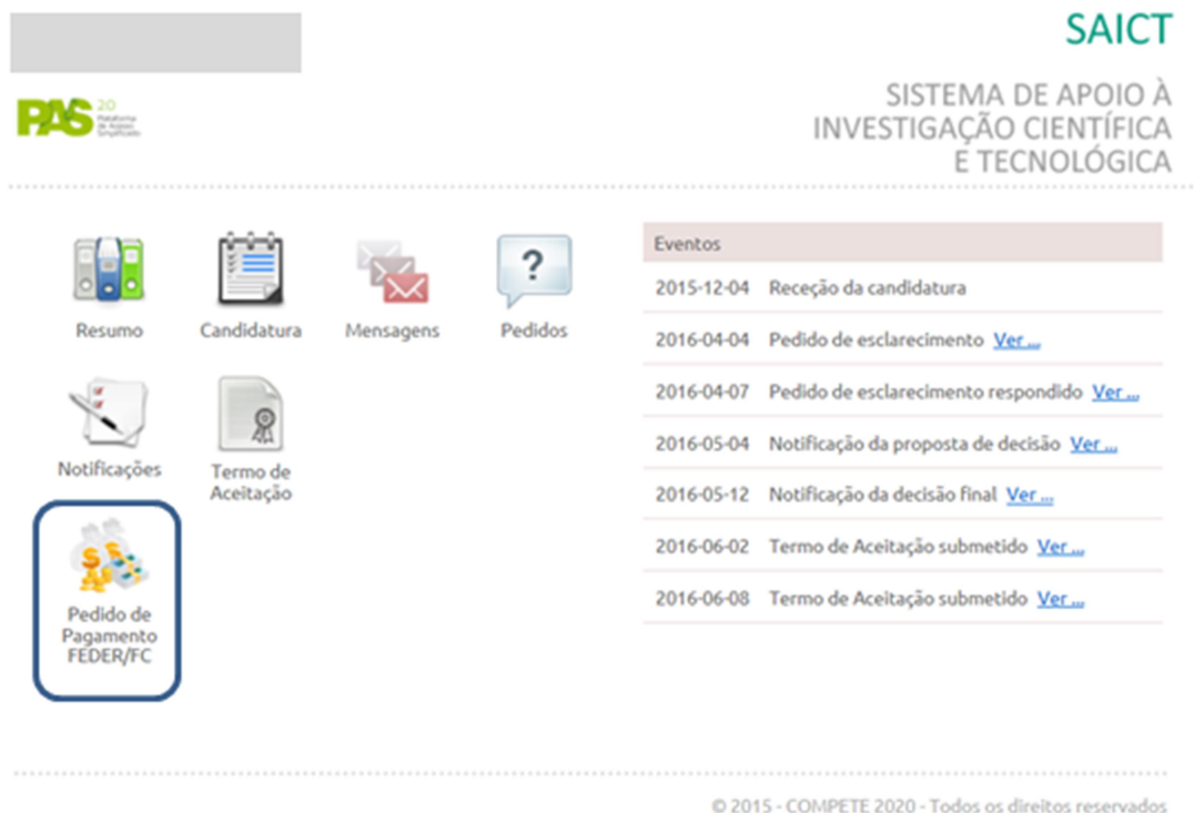
Figura 3 – Balcão do projeto (projeto selecionado).

Após esse passo, tem acesso às informações para o projeto selecionado, incluindo a acesso ao módulo de Pedido de Pagamento FEDER/FC (Figura 3).